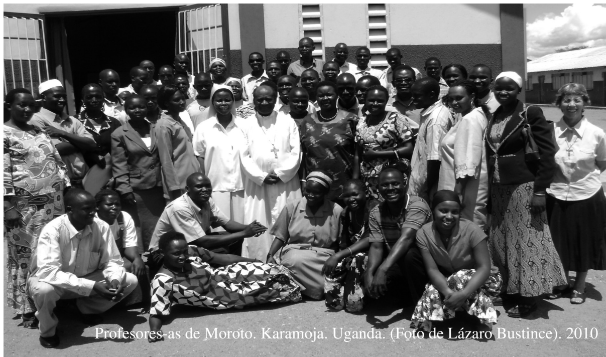
Profesores-as de Moroto. Karamoja. Uganda. (Foto de Lázaro Bustince). 2010

Las estadísticas de UNISIDA 2012 muestran la eficacia de las campañas de sensibilización. La disminución de nuevos casos en los países más afectados por la pandemia ha sido espectacular.