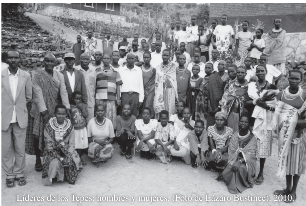
Líderes de los Tepes: hombres y mujeres. 2010.