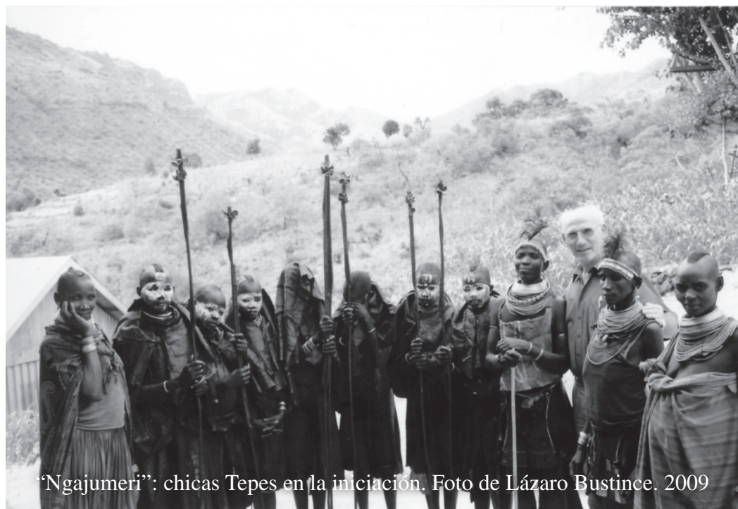
‘Ngajumeri’: chicas Tepes en la iniciación. 2009