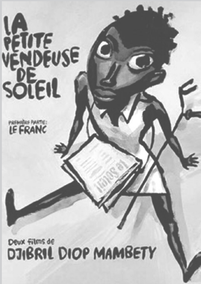
Cartel promocional de la película Le petite vendeuse de Soleil (1998).