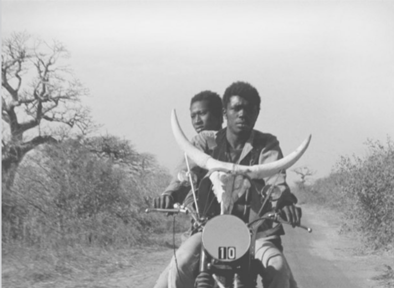
Escenas de la película Touki Bouki (1973).