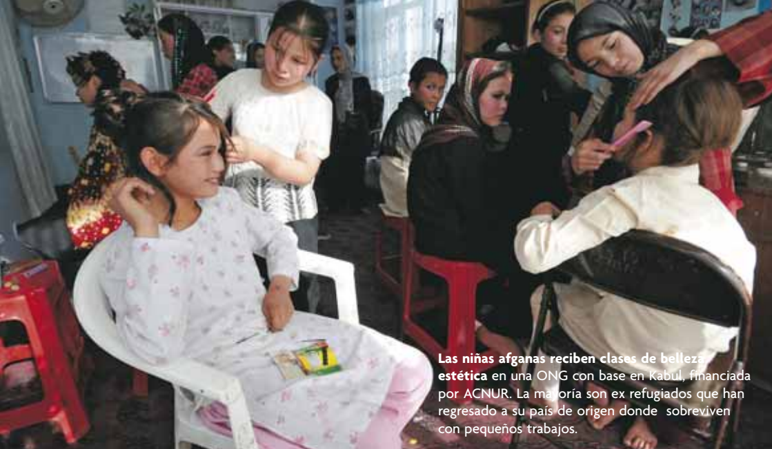
Las niñas afganas reciben clases de belleza estética en una ONG con base en Kabul, financiada por ACNUR. La mayoría son ex refugiados que han regresado a su país de origen donde sobreviven con pequeños trabajos.