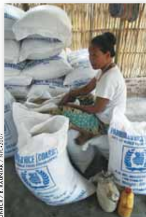
Muchas operaciones y proyectos de ACNUR se llevan a cabo conjuntamente con otras organizaciones como el Programa Mundial de Alimentos.

Conforme fue aumentado el número de personas bajo el amparo del ACNUR, su presupuesto anual se incrementó a mil millones de dólares a principios de los años 90. En 2007 el presupuesto de ACNUR fue de 1.400 millones de dólares y de 1.800 millones en 2008. El presupuesto del programa anual del ACNUR incluye programas generales que apoyan operaciones regulares y programas especiales empleados para cubrir emergencias u operaciones de repatriación a gran escala, como por ejemplo el retorno y la reintegración de refugiados y desplazados internos congoleños y sudaneses.