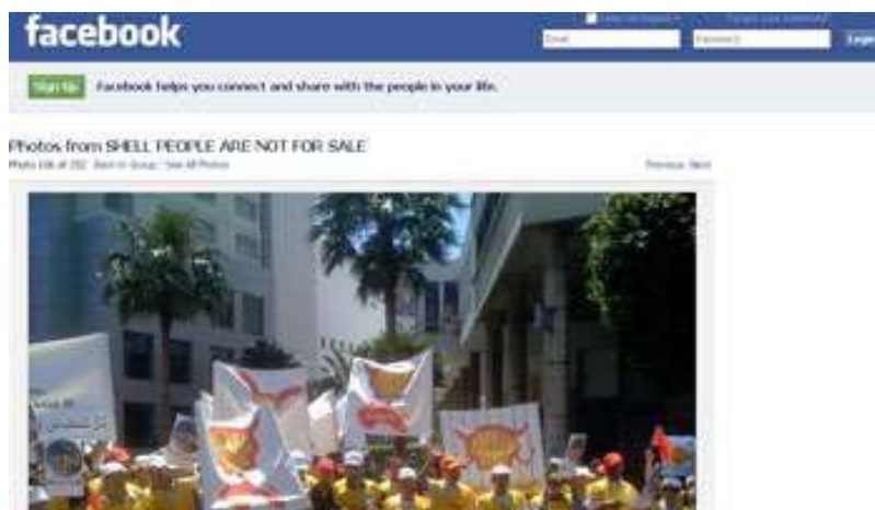
Captura de pantalla de un forum en Facebook de los asalariados de Shell. Facebook

¿Asistimos a la primera movilización sindical coordinada a la escala del continente africano? Al anunciar que se proponía ceder sus actividades “río abajo” en 21 países de África, el grupo Shell no solamente alarmó a sus 3.000 asalariados del continente; también logró el consenso de todos en su contra.