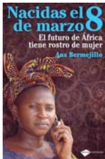
Portada del libro

Quince testimonios de emprendedoras africanas reflejan el esfuerzo diario por alcanzar el reto de la supervivencia y el desarrollo a través de un recorrido por lo más 'desconocido' y olvidado de Tanzania, Senegal, Namibia, Cabo Verde, Etiopía, Gambia, Marruecos y Mozambique: sus mujeres