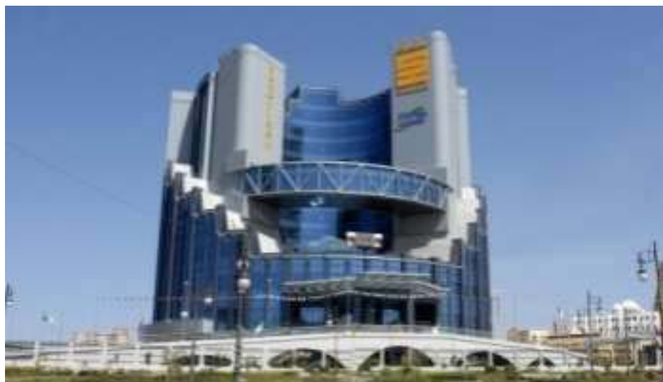
La sede regional de Sonatrach, en Oran.

Las cuarenta empresas africanas más grandes han sido pasadas al escáner por el gabinete internacional de consejo Boston Consulting Group (BCG). Conclusión del estudio: el continente se sitúa como uno de los mercados mundiales más prometedores, a semejanza de los BRIC.